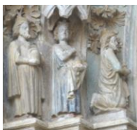
Détail tympan église Santa Maria d'Ollite (Navarre)