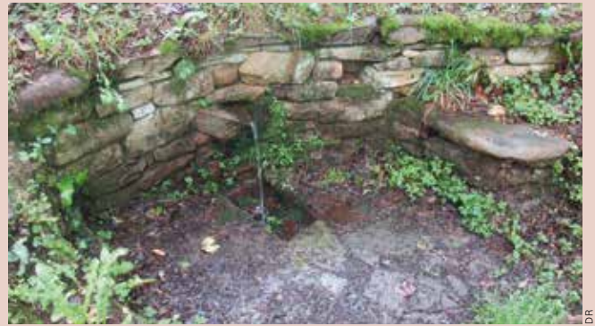
La source Saint-Antoine.

Les populations locales lui prêtaient des pouvoirs curatifs miraculeux, auxquels la proximité du sanctuaire n'était pas étrangère. Lors de la fête de la Saint-Jean, la fontaine recevait la visite des malades qui lavaient leurs lésions avec des morceaux de tissu blanc, qu'ils accrochaient ensuite aux arbustes alentour. Leurs ablutions terminées, ils se rendaient à l'oratoire voisin, pour implorer l'intercession