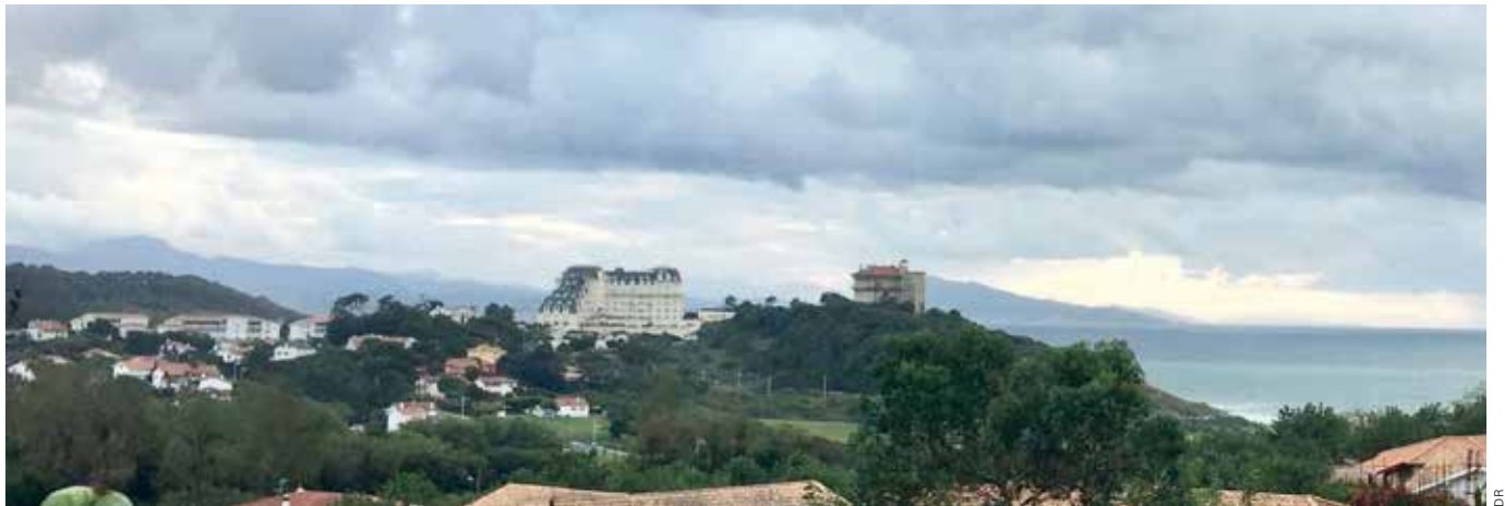
« Nous ne pouvons pas tomber hors de ce monde » (citation extraite de Hannibal, livre de Christian Dietrich Grabbe).

D'aussi loin qu'on s'en souviene, le château d'Ilbarritz a toujours été là, érigé et seul. Dominant et indifférent. Les hommes, bien sûr, ont tenté de l'appivoiser; il ne les a jamais laissé faire. Ils ont voulu l'habiter, ils l'ont imaginé, il les a tous rejetés. Tour à tour, alcôve éphémère d'amoureux malheureux, repaire épisodique d'un mélomane solitaire, hôpital le temps d'une guerre, repaire de soldats occupants, le temps d'une autre, hôtel... Rien n'y a fait, il a tout refusé.