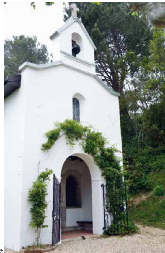
La façade étroite de la chapelle surmontée de son clocheton.

Voilà deux années consécutives que la procession, remise en vigueur en 2015 – et avec quel succès! – par l'abbé Martinon, curé de la paroisse Saint-Joseph-des-Falaises – Bidart-Guethary-Acotz, a dû être annulée pour cause de pandémie de Covid-19. Fanfare et pique-nique convivial venaient produit après un vide de plus d'un demi-siècle, alors que la tradition ancestrale évoquait de grands rituels religieux très courus.