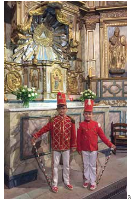
Deux makilari dans l'église de Saint-Pée.

Enfin, si le basque est courageux – ses pêcheurs n'ont-ils pas bravé la peur et les risques pour s'aventurer en un périple interminable sur les côtes de Terre-Neuve pour la pêche à la morue ou la chasse à la baleine – il est travailleur, doué d'énergie, d'esprit d'initiative et collectif. Il a perçu qu'il devait prendre son destin en main sans attendre que nos gouvernants le lui offrent de « là-haut ». Ce pays est fait de femmes et d'hommes qui résistent et qui sont capables de répondre à ses besoins en créant de nombreuses structures mais sans se laisser envoûter par le pernicieux dieu-argent. La création d'entreprises et associations de toutes sortes dans les domaines économique, social, humanitaire, écologique, l'ouverture