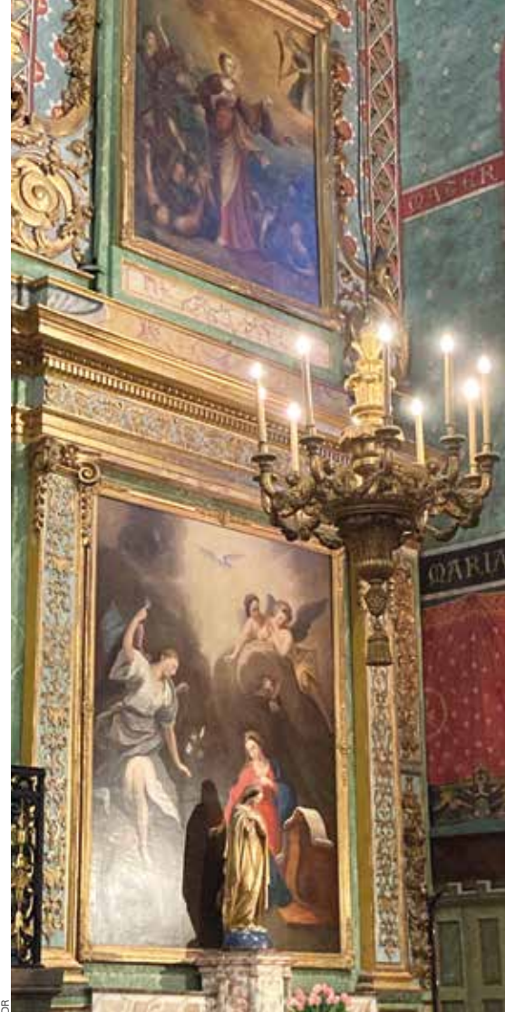
Sainte Catherine et de l'Annonciation Chapelle de la Vierge, église de Saint-Jean-de-Luz.