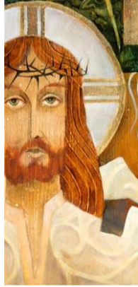
Détail du chemin de croix de l'église de Bidart

Piztu da Kristo, Alléluia ! Gu baitan dago, Alléluia ! Christ est ressuscité, Il vit en nous Jainkoak baitu gaur kristo piztu, Alléluia ! Bere indarrak piztuko gaitu, Alléluia ! Alléluia ! Aujourd'hui le Père a ressuscité le Christ, sa force nous ressuscitera aussi.